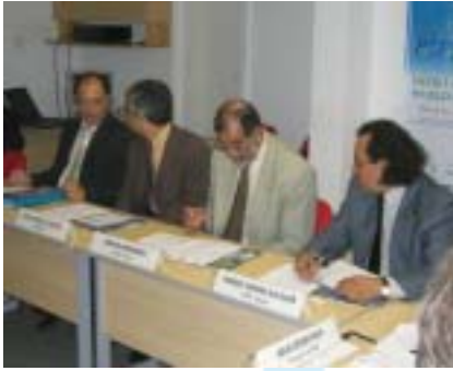
Encontro na sede da SBM com representantes de instituições similares da América Latina

Mundial da Imeko, que será realizado pela primeira vez na América do Sul, em setembro de 2006, no Rio de Janeiro.