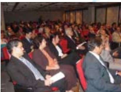
Público do seminário

À tarde, foi realizado, na Federação das Indústrias do Rio de Janeiro (Firjan), o seminário “Metrologia como fator de integração internacional”, que reuniu especialistas de vários segmentos da ciência e da tecnologia, especialmente da área de metrologia, e trouxe ao Brasil o engenheiro belga Leo Van Biesen, presidente da International Measurement Confederation (Imeko). No evento, também foi lançado o XVIII Congresso